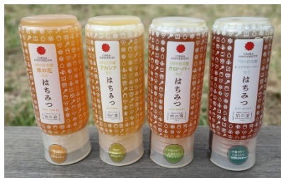
柏の葉産 純粋はちみつ ≪各1,800円≫