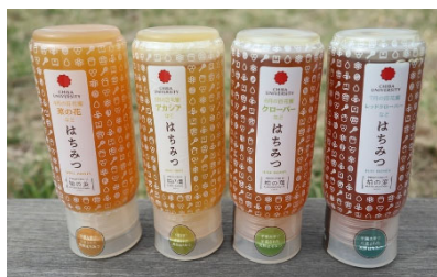
柏の葉産 純粋はちみつ <<各1,800円>>