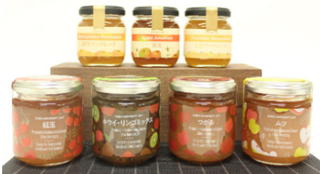
手作りジャム <<各600円>>