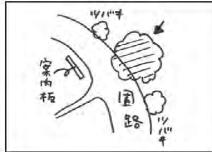
立地平面図(裏面の平面図にもOを付けてください)

内容 (Oを付けてください) 1 枯死、ほぼ枯死 2 かかり枝 3 枯れ枝 4 チャドクガ・イラガ 5 その他( )